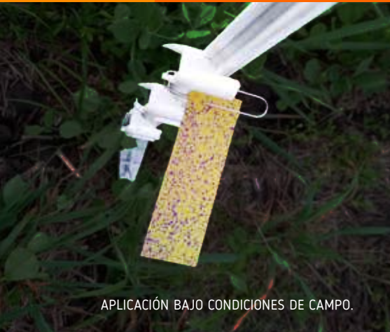
APLICACIÓN BAJO CONDICIONES DE CAMPO.